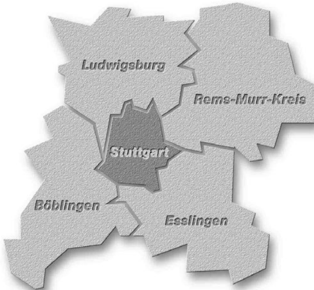
図 6-5-1 VVS エリアを構成する市・郡の位置関係

シュツットガルト運輸・運賃連合 Verkehrs- und Tarifverbund Stuttgart (VVS) は、ドイツ南部バーデン・ビュルテンベルク州の州都、シュツットガルト市を中心として、4つの郡で構成されるエリアで運営されており、シュツットガルト市を始めとした各市・郡の人口は下表の通りである。運輸連合の区域に南東に接するゲッピンゲン郡 (Göppingen) を加えた地域ではシュツットガルト都市圏 (Verband Region Stuttgart) という都市圏連携の枠組みが機能している。