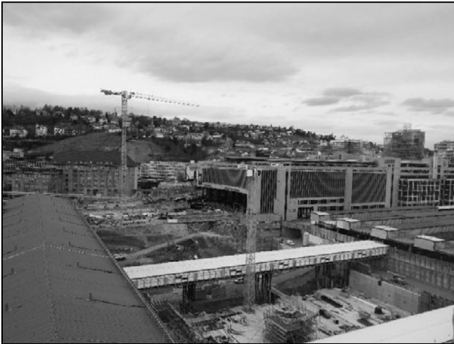
図 6-5-5 シュツットガルト中央駅の工事現場

本プロジェクトの主たる目的は上記の通り長距離・高速鉄道ネットワークの改良であるが、中央駅の現在の地上駅が廃止され、ネットワークが変化することからシュツットガルト市内の近距離鉄道にも影響を及ぼす。このシュツットガルト21を契機として、S-Bahnネットワークの強化も予定されており、現在各系統30分おきに運転されているものを15分おきに増発する事などが検討されている。また、廃止される地上の駅・線路敷跡地には複合的都市再開発が行われることとなっている。