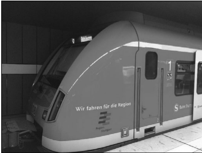
図 6-5-6 シュツットガルトの S-Bahn 車両

※都市圏のロゴマークと「Wir fahren für die Region」(私たちは Region のために走る)という文字が掲示されている。