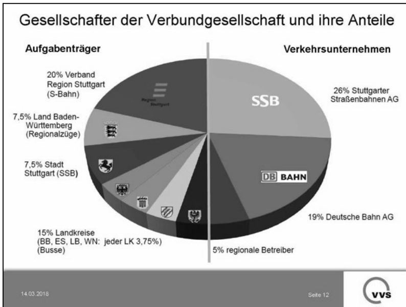
図 6-5-2 VVS の所有者の割合

連合である。行政機関については、それぞれの階層で異なる交通機関の発注者（任務担当者）となっている関係で、シュツットガルト市と4つの郡に加えてバーデン・ビュルテンベルク州とシュツットガルト都市圏が比較的大きな割合を所有している。交通事業者については、シュツットガルト市内の路面電車・バスを運行するSSBが26%と最も大きな割合を占め、次いでS-Bahnや地域鉄道を運行しているドイツ鉄道DBが19%、その他の地域内の事業者が合計で5%となっている。SSBはシュツットガルト市の市営企業であるため、市は行政機関・交通事業者双方の立場からVVSの運営・経営に大きく関わっている。