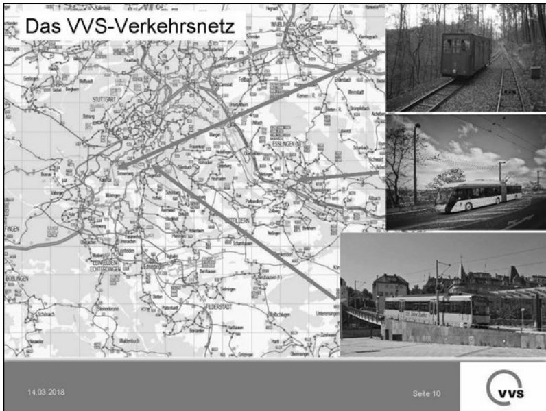
図 6-5-4 ユニークな交通機関