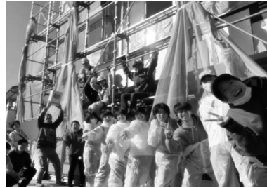
写真 6-3 地域交流拠点づくり (栃木県真岡市)

お手伝いではなく若者（高校生～40代）が企画から実現までを主導することで若者の強い動機「自己成長と技術習得・発揮」を感じやすい。