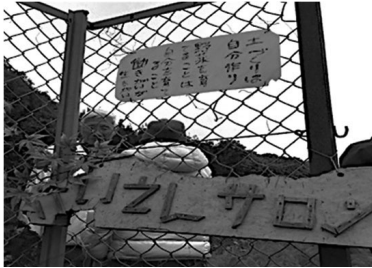
写真 6-2 地域共同農園 (横浜市南区)

特にやりたい内容を持たない高齢者に対して、高齢者の強い動機「社会適応」に働きかける活動となり、男性高齢者が多く参加している。