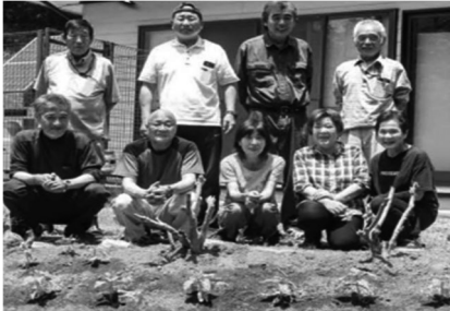
写真 6-1 田村市集落支援員だより

つながっていく。こうした経験はその先にある住民組織づくり、公的な意思決定に積極的に参加する人、つまり“大きな参加”を育むことにつながってゆくだらう。本稿はその土地で暮らす1人ひとりの主体形成を考えてみたい。