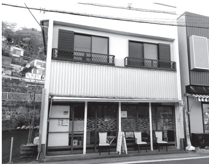
図8-2 くらしかる真鶴