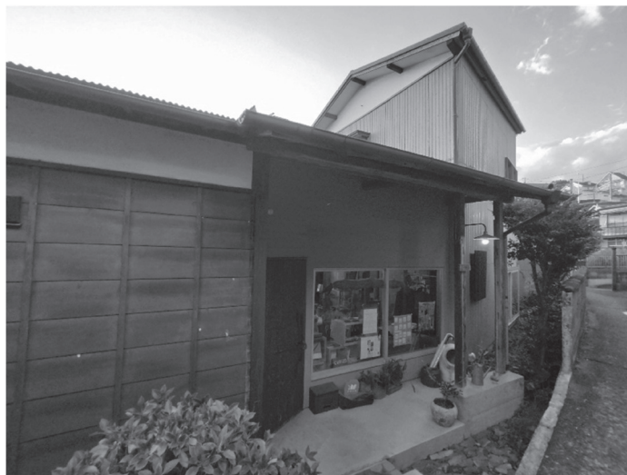
図 8-3 真鶴出版