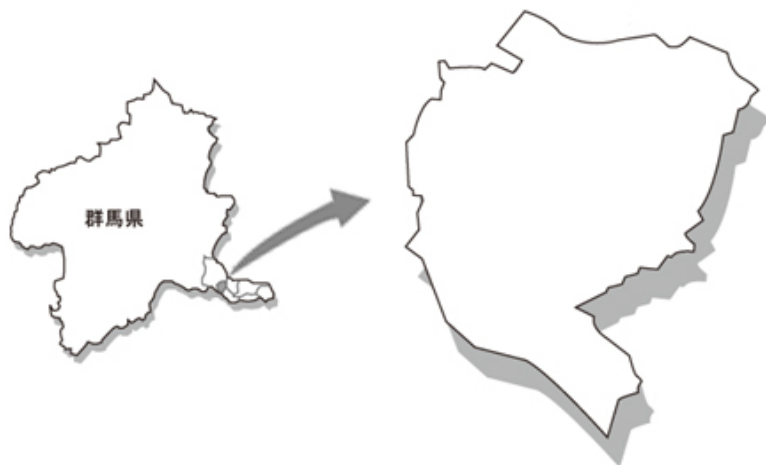
図 8-5 大泉町の位置