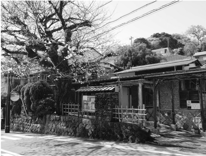
図 8-4 コミュニティ真鶴